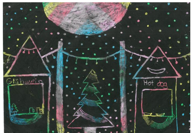
Weihnachtsbild von Pauline, Klasse 5c

Wir wünschen Ihnen und Euch ein frohes Weihnachtsfest!